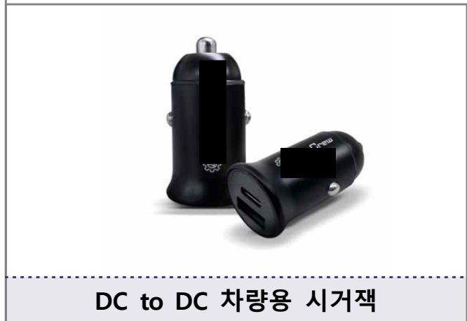
DC to DC 차량용 시거잭