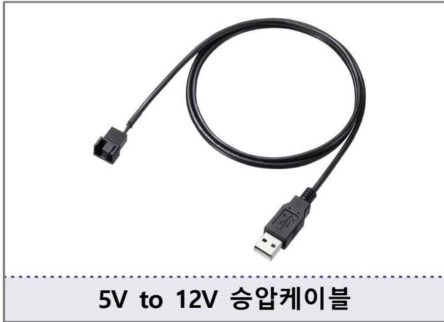
5V to 12V 승압케이블