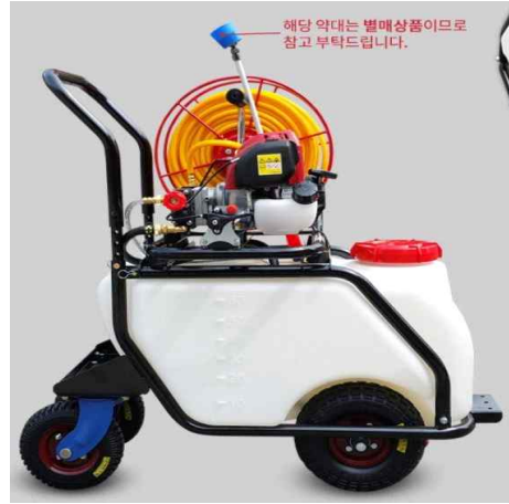
농약 분무기(220V 전원)