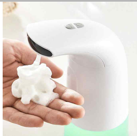
비누액 디스펜서 ※ 분무가 아닌 비누,젤 형태는 비대상