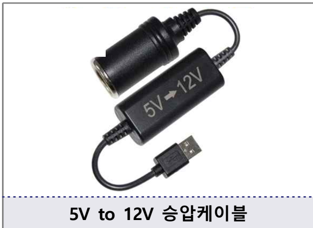
5V to 12V 승압케이블