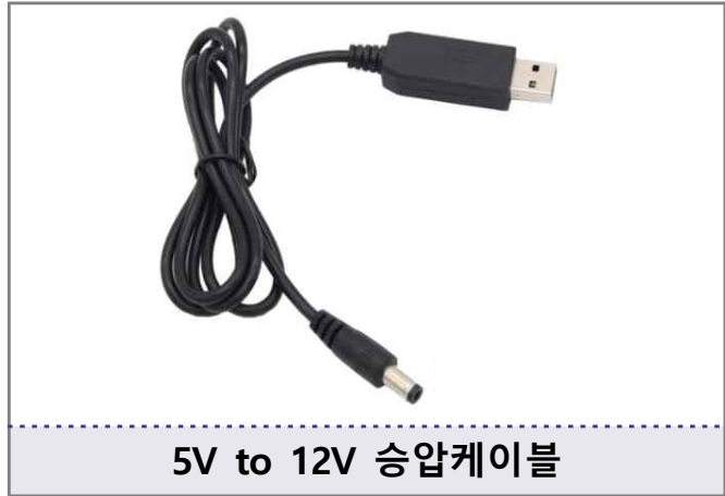
5V to 12V 승압케이블