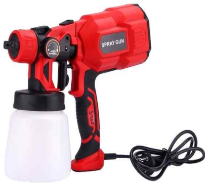
페인트류 분무기(220V 전원)