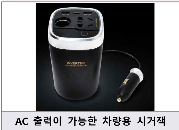
AC 출력이 가능한 차량용 시거잭