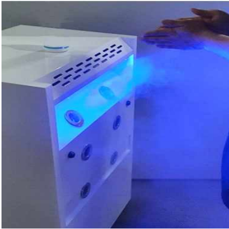
소독 분무기(220V 전원)